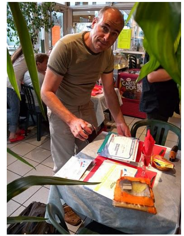
Notre directeur technique en pleine séance de signatures