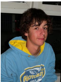
Sourires et satisfactions apparents