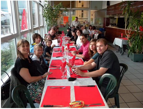
Sourires et bonne humeur étaient au rendez-vous