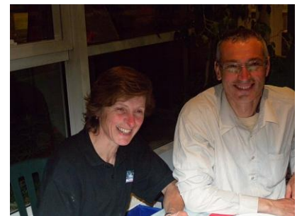
Notre président apprécie ainsi que notre « présidente »