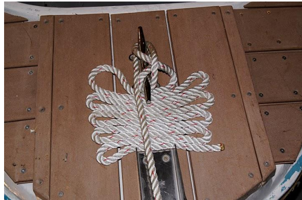
OHHH la jolie fleur.