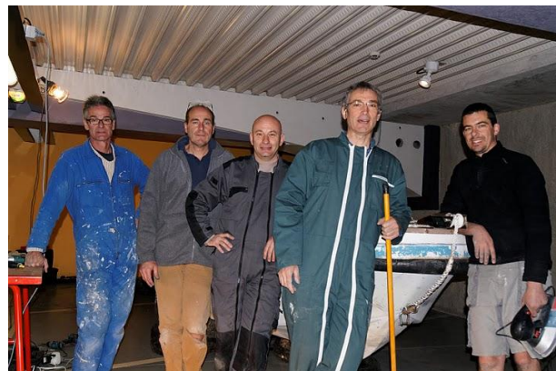
Et voilà, Aquateam est prêt pour une nouvelle saison. Et à voir la satisfaction apparente des travailleurs, il semble que tout se soit fait sans gros soucis.