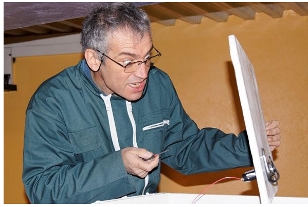
Notre président dans ses œuvres. Quelque chose semble lui résister.